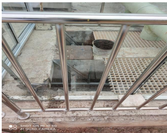
图 3-3 封闭式格栅间