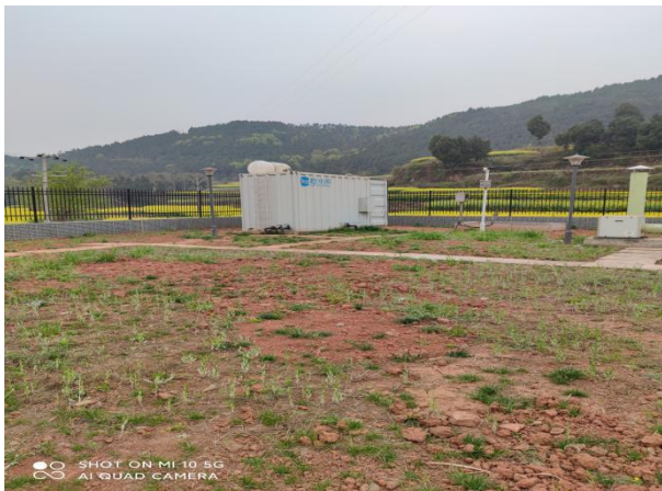
图 3-1 封闭式一体化处理设施

验收监测期间，四川齐荣检测有限责任公司于 2021 年 6 月 23 日至 24 日对厂区无组织废气进行了监测，监测结果表明，无组织废气（氨、硫化氢）排放浓度满足《城镇污水处理厂污染物排放标准》（GB18918-2002）表 4 中二级标准（氨 1.5\text{mg}/\text{m}^3 、硫化氢 0.06\text{mg}/\text{m}^3 ）。