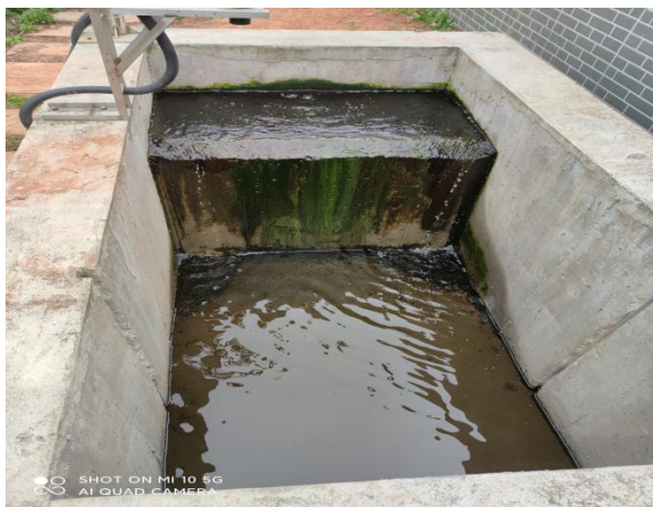
图 3-5 出水明渠

综上，验收监测期间，四川齐荣检测有限责任公司于 2021 年 6 月 23 日至 24 日对废水排放口进行了监测，监测结果表明，项目产生的生活污水经二级生化处理后能够达到《城镇污水处理厂污染物排放标准》（GB18918-2002）中一级 A 标准，满足达标排放要求。