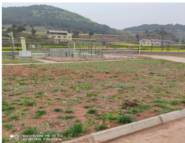
图 3-4 厂区绿化