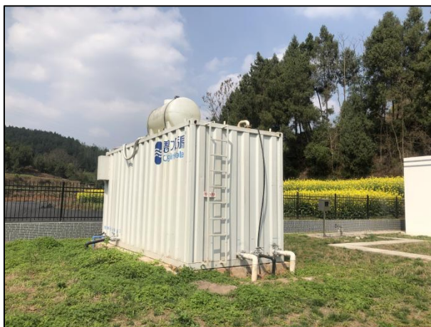
图 3-4 全封闭的一体化污水处理设备