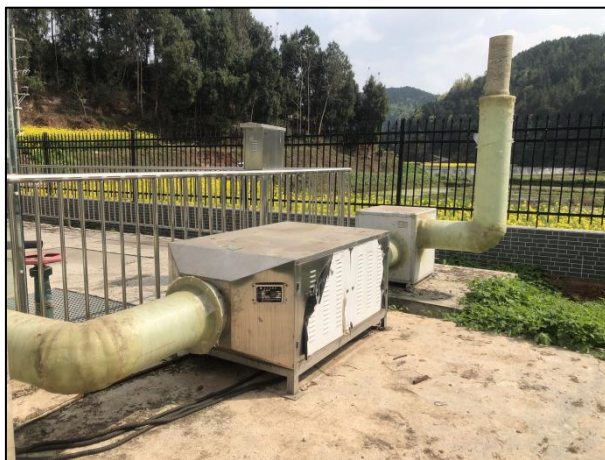
图 3-2 离子除臭装置