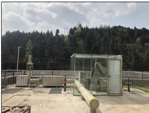
图 3-1 格栅单独隔间、废气收集管道

验收监测期间，四川齐荣检测有限责任公司于 2021 年 7 月 5 日至 6 日对离子除臭设备的排气筒进行了监测，监测结果表明，本项目无组织废气（氨、硫化氢）排放浓度满足《城镇污水处理厂污染物排放标准》（GB18918-2002）表 4 中二级标准（氨 1.5\text{mg}/\text{m}^3 、硫化氢 0.06\text{mg}/\text{m}^3 ）。