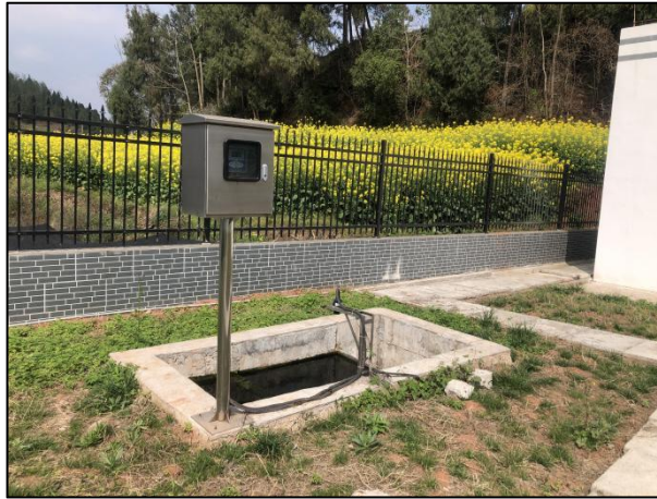
图 3-5 出水明渠

综上，验收监测期间，四川齐荣检测有限责任公司于 2021 年 7 月 5 日至 6 日对废水排放口进行了监测，监测结果表明，项目产生的生活污水经处理后能够达到《城镇污水处理厂污染物排放标准》（GB18918-2002）中一级 A 标准，满足达标排放要求。