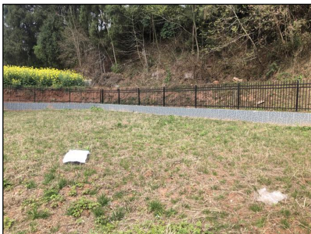
图 3-3 厂区绿化