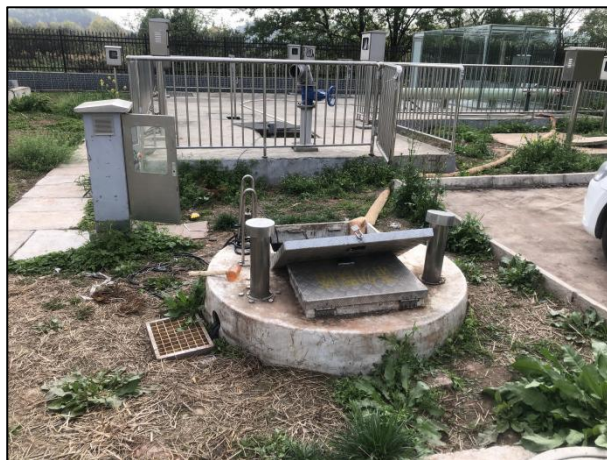
图 3-6 进水井