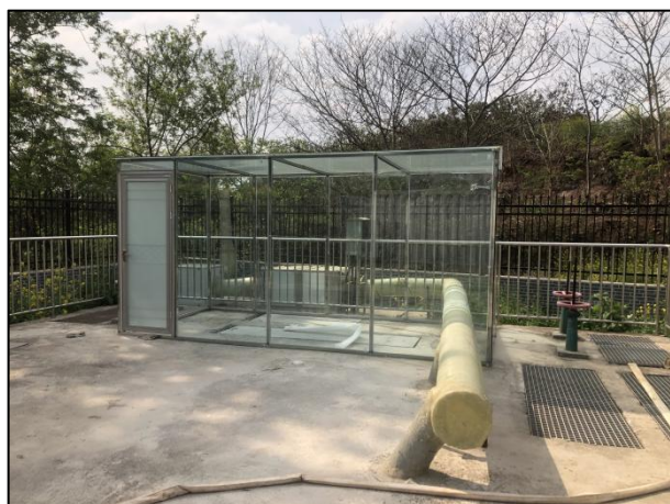
图 3-3 封闭式格栅间