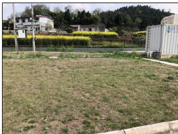
图 3-4 厂区绿化