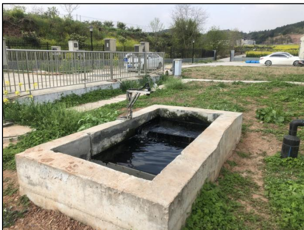
图 3-5 出水明渠

综上，验收监测期间，四川齐荣检测有限责任公司于 2021 年 7 月 5 日至 6 日对废水排放口进行了监测，监测结果表明，项目产生的生活污水经生化处理后能够达到《城镇污水处理厂污染物排放标准》（GB18918-2002）中一级 A 标准，满足达标排放要求。