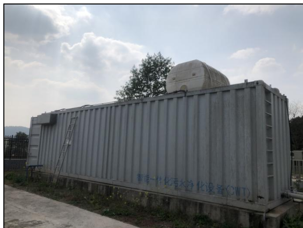
图 3-1 封闭式一体化处理设施

验收监测期间，四川齐荣检测有限责任公司于 2021 年 7 月 5 日至 6 日对厂区无组织废气进行了监测，监测结果表明，无组织废气（氨、硫化氢）排放浓度满足《城镇污水处理厂污染物排放标准》（GB18918-2002）表 4 中二级标准（氨 1.5\text{mg}/\text{m}^3 、硫化氢 0.06\text{mg}/\text{m}^3 ）。