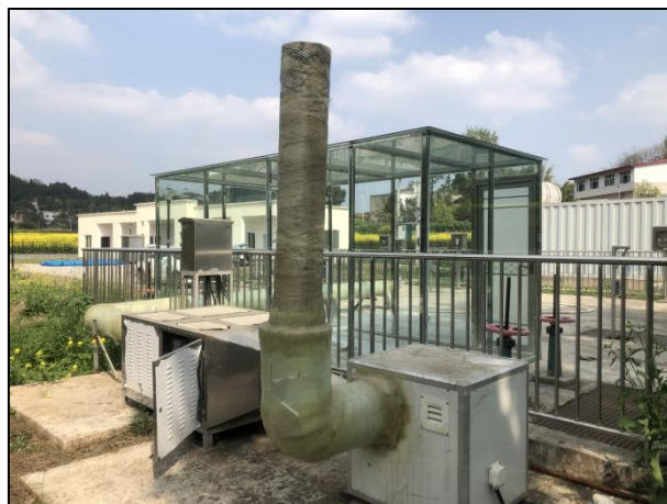
图 3-2 离子除臭装置