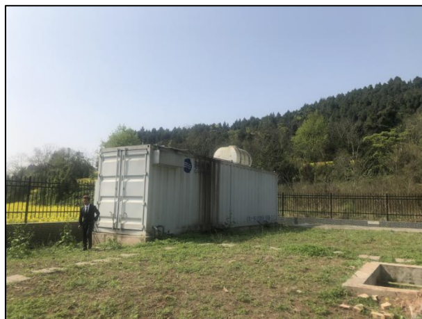
图 3-4 全封闭的一体化污水处理设备