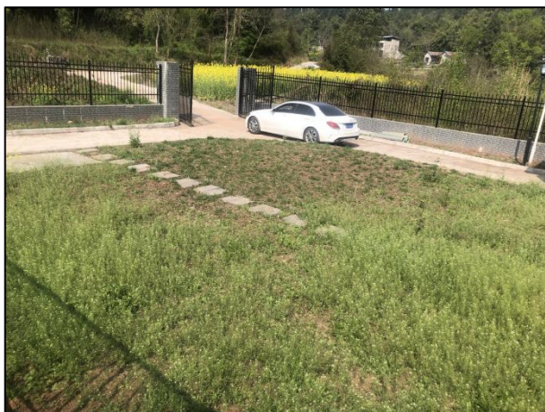
图 3-3 厂区绿化