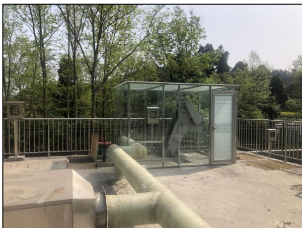
图 3-1 格栅单独隔间、废气收集管道

验收监测期间，四川齐荣检测有限责任公司于 2021 年 7 月 7 日至 8 日对离子除臭设备的排气筒进行了监测，监测结果表明，本项目无组织废气（氨、硫化氢）排放浓度满足《城镇污水处理厂污染物排放标准》（GB18918-2002）表 4 中二级标准（氨 1.5\text{mg}/\text{m}^3 、硫化氢 0.06\text{mg}/\text{m}^3 ）。