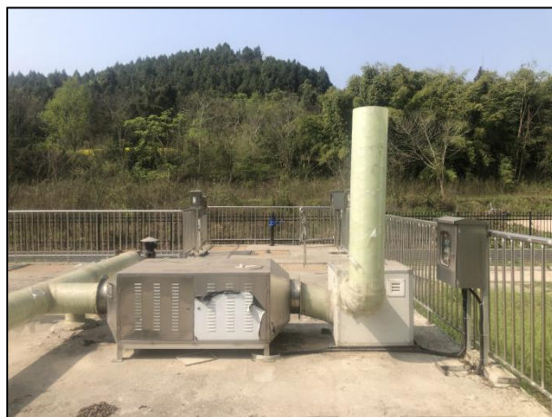
图 3-2 离子除臭装置