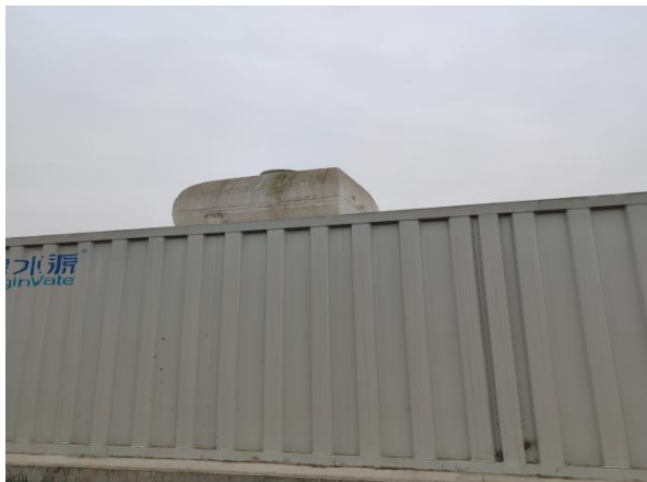
图 3-1 封闭式一体化处理设施

验收监测期间，四川齐荣检测有限责任公司于 2021 年 8 月 2 日至 3 日对厂区无组织废气进行了监测，监测结果表明，无组织废气（氨、硫化氢）排放浓度满足《城镇污水处理厂污染物排放标准》（GB18918-2002）表 4 中二级标准（氨 1.5\text{mg}/\text{m}^3 、硫化氢 0.06\text{mg}/\text{m}^3 ）。