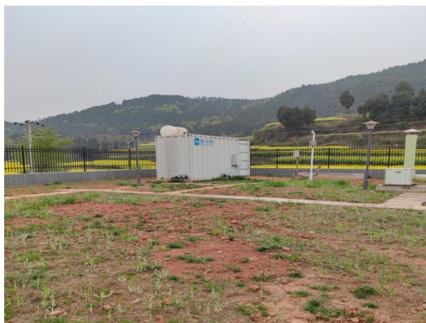
图 3-4 厂区绿化