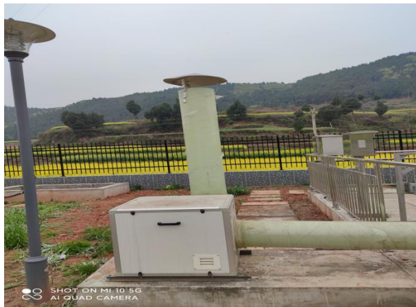
图 3-2 离子除臭装置