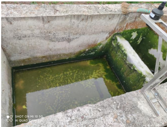
图 3-5 出水明渠

综上，验收监测期间，四川齐荣检测有限责任公司于 2021 年 8 月 2 日至 3 日对废水排放口进行了监测，监测结果表明，项目产生的生活污水经二级生化处理后能够达到《城镇污水处理厂污染物排放标准》（GB18918-2002）中一级 A 标准，满足达标排放要求。