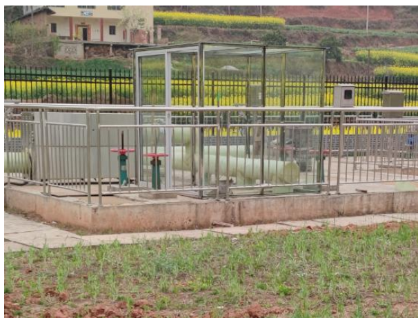
图 3-3 封闭式格栅间