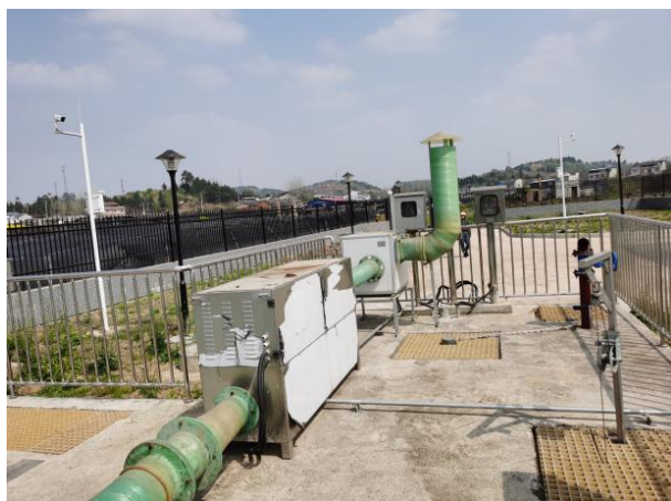
图 3-2 离子除臭装置