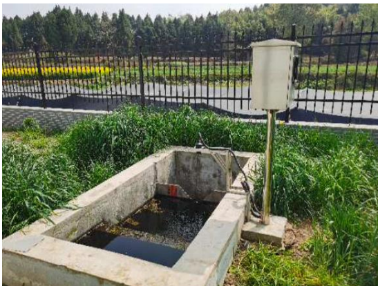
图 3-5 出水明渠

综上，验收监测期间，四川齐荣检测有限责任公司于 2021 年 8 月 4 日至 5 日对废水排放口进行了监测，监测结果表明，项目产生的生活污水经二级生化处理后能够达到《城镇污水处理厂污染物排放标准》（GB18918-2002）中一级 A 标准，满足达标排放要求。