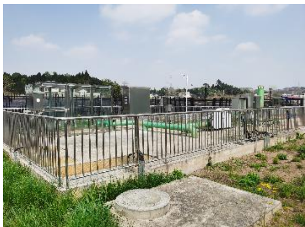
图 3-4 封闭式格栅间