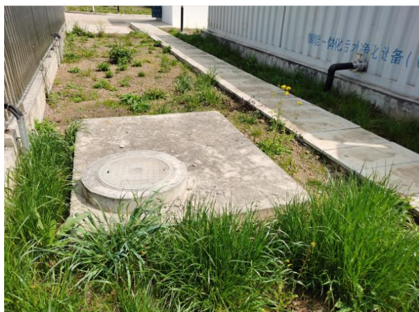
图 3-3 厂区绿化