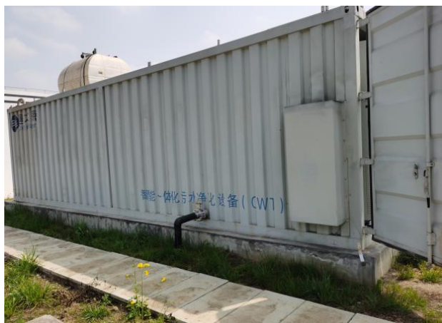
图 3-1 封闭式一体化处理设施

验收监测期间，四川齐荣检测有限责任公司于 2021 年 8 月 4 日至 5 日对厂区无组织废气进行了监测，监测结果表明，无组织废气（氨、硫化氢）排放浓度满足《城镇污水处理厂污染物排放标准》（GB18918-2002）表 4 中二级标准（氨 1.5\text{mg}/\text{m}^3 、硫化氢 0.06\text{mg}/\text{m}^3 ）。