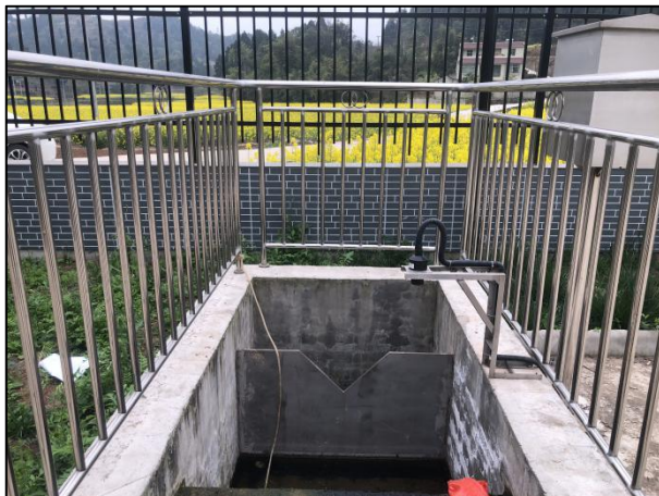
图 3-5 出水明渠

综上，验收监测期间，四川齐荣检测有限责任公司于 2021 年 9 月 1 日至 2 日对废水排放口进行了监测，监测结果表明，项目产生的生活污水经二级生化处理后能够达到《城镇污水处理厂污染物排放标准》（GB18918-2002）中一级 A 标准，满足达标排放要求。