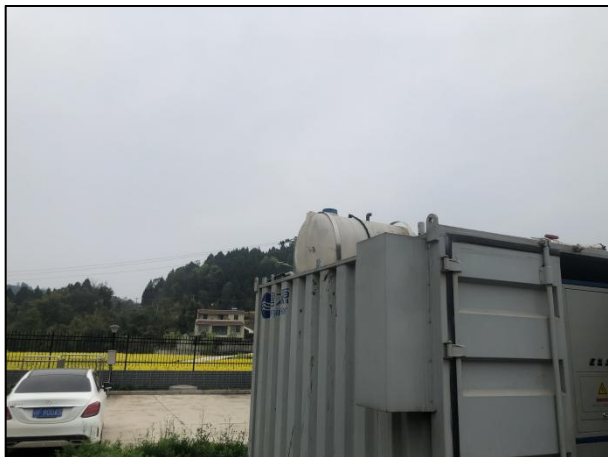
图 3-1 封闭式一体化处理设施

验收监测期间，四川齐荣检测有限责任公司于 2021 年 9 月 1 日至 2 日对厂区无组织废气进行了监测，监测结果表明，无组织废气（氨、硫化氢）排放浓度满足《城镇污水处理厂污染物排放标准》（GB18918-2002）表 4 中二级标准（氨 1.5\text{mg}/\text{m}^3 、硫化氢 0.06\text{mg}/\text{m}^3 ）。