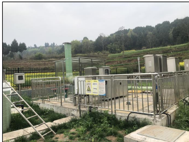
图 3-2 离子除臭装置