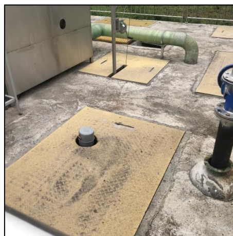
图 3-4 构筑物封闭处理