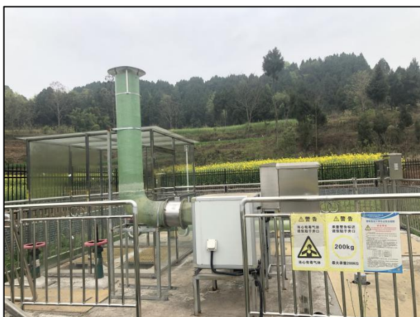
图 3-3 封闭式格栅间