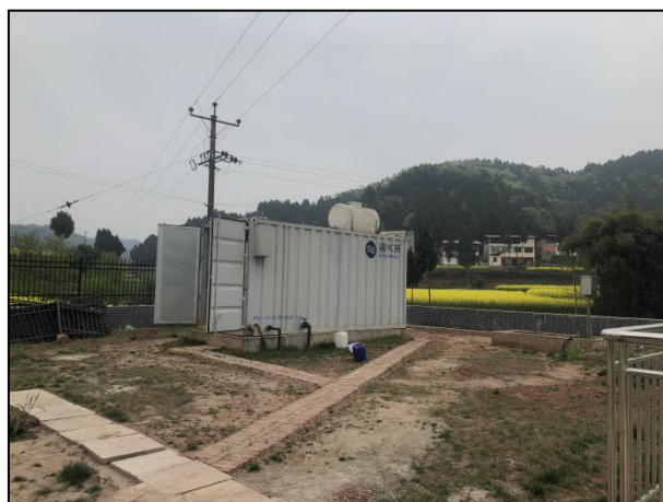
图 3-4 绿化