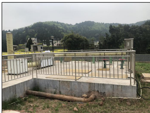
图 3-3 构筑物封闭处理