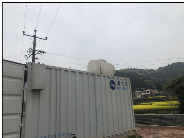
图 3-1 封闭式一体化处理设施

验收监测期间，四川齐荣检测有限责任公司于 2021 年 10 月 11 日至 12 日对厂区无组织废气进行了监测，监测结果表明，无组织废气（氨、硫化氢）排放浓度满足《城镇污水处理厂污染物排放标准》(GB18918-2002)表 4 中二级标准(氨 1.5\text{mg}/\text{m}^3 、硫化氢 0.06\text{mg}/\text{m}^3 )。