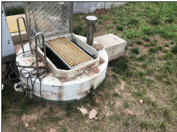
图 3-5 进水口

综上，验收监测期间，四川齐荣检测有限责任公司于 2021 年 9 月 1 日至 2 日对废水排放口进行了监测，监测结果表明，项目产生的生活污水经二级生化处理后能够达到《城镇污水处理厂污染物排放标准》（GB18918-2002）中一级 A 标准，满足达标排放要求。