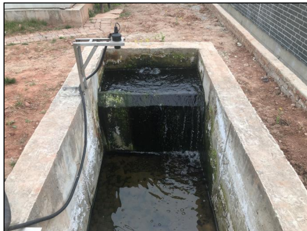
图 3-2 出水口