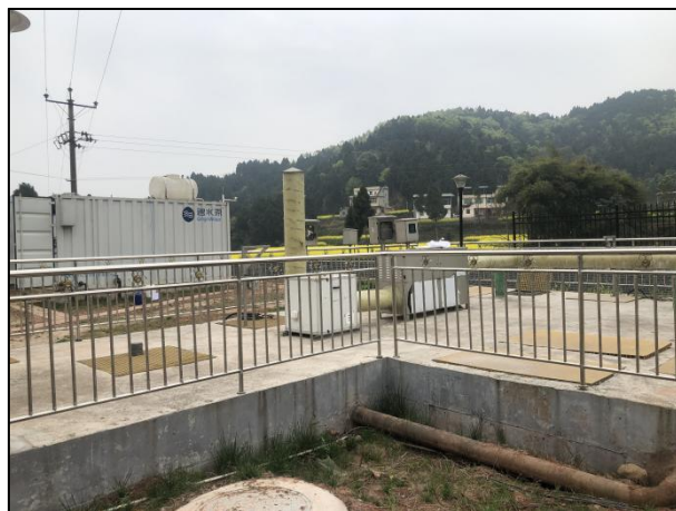
图 3-2 离子除臭装置