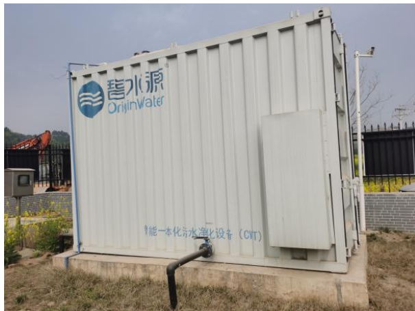
图 3-1 封闭式一体化处理设施

验收监测期间，四川齐荣检测有限责任公司于 2021 年 9 月 6 日至 7 日对厂区无组织废气进行了监测，监测结果表明，无组织废气（氨、硫化氢）排放浓度满足《城镇污水处理厂污染物排放标准》（GB18918-2002）表 4 中二级标准（氨 1.5\text{mg}/\text{m}^3 、硫化氢 0.06\text{mg}/\text{m}^3 ）。