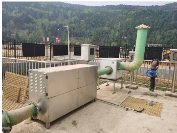
图 3-2 离子除臭装置