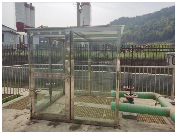
图 3-3 封闭式格栅间