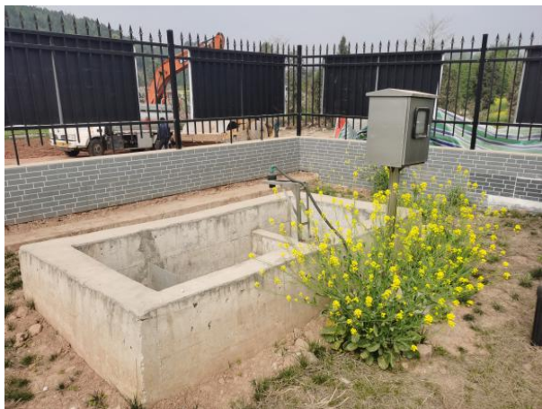
图 3-5 出水明渠

放口进行了监测，监测结果表明，项目产生的生活污水经二级生化处理后能够达到《城镇污水处理厂污染物排放标准》（GB18918-2002）中一级 A 标准，满足达标排放要求。