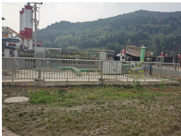
图 3-3=4 厂区绿化