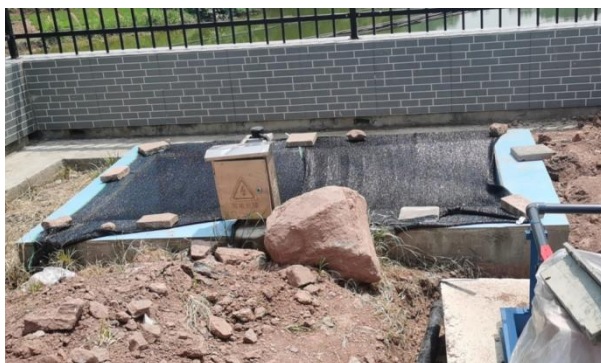
图 3-5 出水明渠

综上，验收监测期间，四川齐荣检测有限责任公司于 2023 年 3 月 13 日至 14 日对废水排放口进行了监测，监测结果表明，项目污水经处理后能够达到《城镇污水处理厂污染物排放标准》（GB18918-2002）中一级 A 标准，满足达标排放要求。