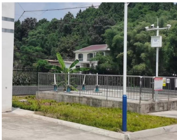
图 3-3 厂区绿化