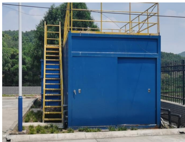
图 3-4 全封闭的一体化污水处理设备