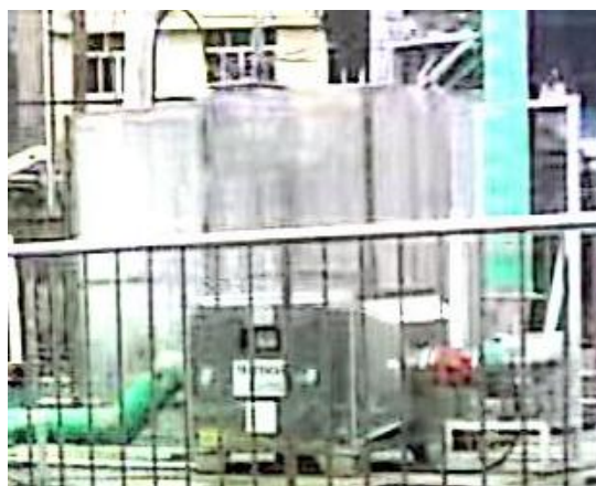
图 3-2 离子除臭装置