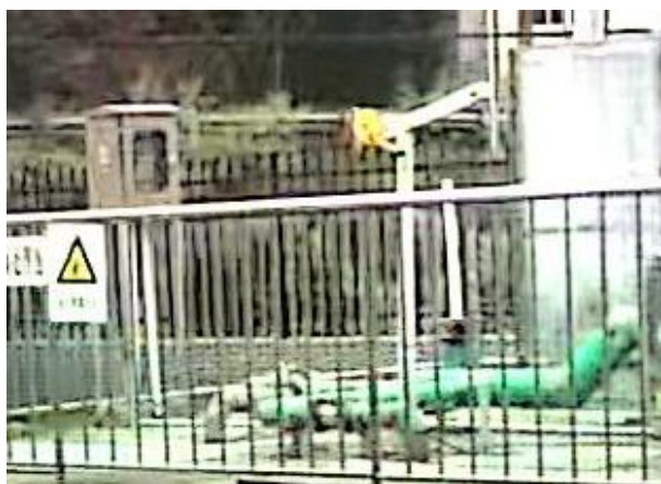
图 3-1 废气收集管道

验收监测期间，四川齐荣检测有限责任公司于 2023 年 3 月 13 日至 14 日对厂界无组织废气进行了监测，监测结果表明，本项目无组织废气（氨、硫化氢）排放浓度满足《城镇污水处理厂污染物排放标准》（GB18918-2002）表 4 中二级标准（氨 1.5\text{mg}/\text{m}^3 、硫化氢 0.06\text{mg}/\text{m}^3 ）。