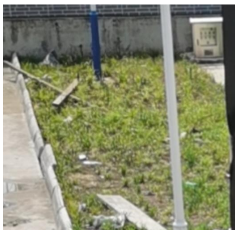
图 3-3 厂区绿化