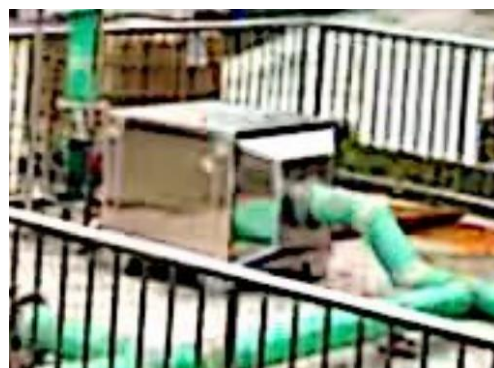
图 3-2 离子除臭装置