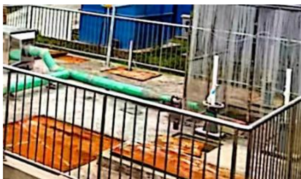
图 3-1 废气收集管道

验收监测期间，四川齐荣检测有限责任公司于 2023 年 3 月 22 日至 23 日对厂界无组织废气进行了监测，监测结果表明，本项目无组织废气（氨、硫化氢）排放浓度满足《城镇污水处理厂污染物排放标准》（GB18918-2002）表 4 中二级标准（氨 1.5\text{mg}/\text{m}^3 、硫化氢 0.06\text{mg}/\text{m}^3 ）。