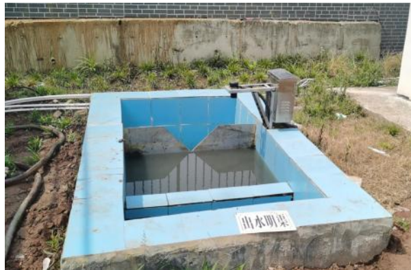
图 3-5 出水明渠

综上，验收监测期间，四川齐荣检测有限责任公司于 2023 年 3 月 22 日至 23 日对废水排放口进行了监测，监测结果表明，项目污水经处理后能够达到《城镇污水处理厂污染物排放标准》（GB18918-2002）中一级 A 标准，满足达标排放要求。