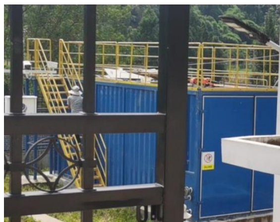
图 3-4 全封闭的一体化污水处理设备