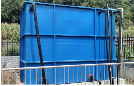
图 3-5 全封闭的一体化污水处理设备