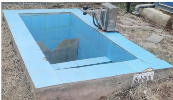
图 3-5 出水明渠

综上，验收监测期间，四川齐荣检测有限责任公司于 2023 年 5 月 15 日至 16 日对废水排放口进行了监测，监测结果表明，项目污水经处理后能够达到《城镇污水处理厂污染物排放标准》（GB18918-2002）中一级 A 标准，满足达标排放要求。