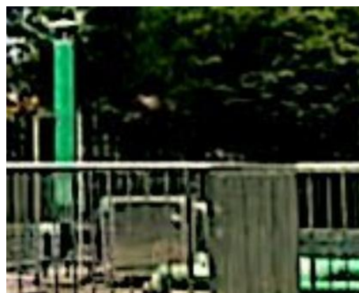
图 3-2 离子除臭装置