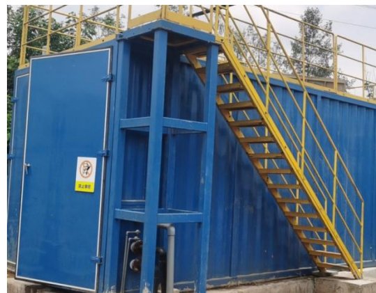
图 3-4 全封闭的一体化污水处理设备