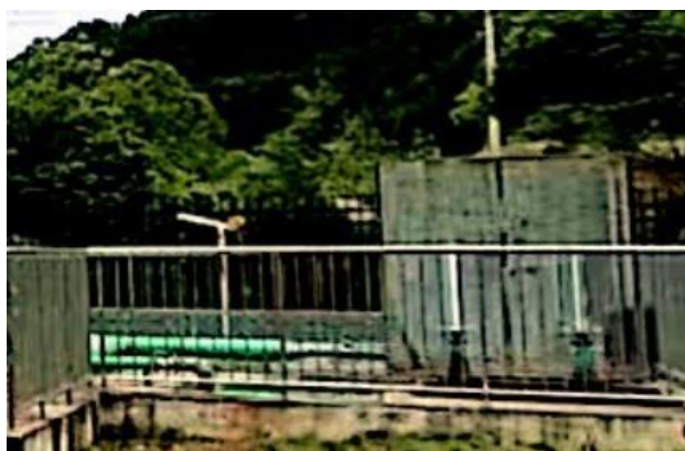
图 3-1 废气收集管道

验收监测期间，四川齐荣检测有限责任公司于 2023 年 5 月 15 日至 16 日对厂界无组织废气进行了监测，监测结果表明，本项目无组织废气（氨、硫化氢）排放浓度满足《城镇污水处理厂污染物排放标准》（GB18918-2002）表 4 中二级标准（氨 1.5\text{mg}/\text{m}^3 、硫化氢 0.06\text{mg}/\text{m}^3 ）。