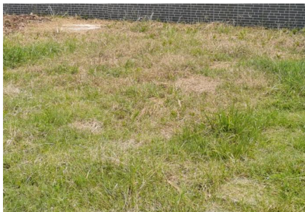
图 3-3 厂区绿化