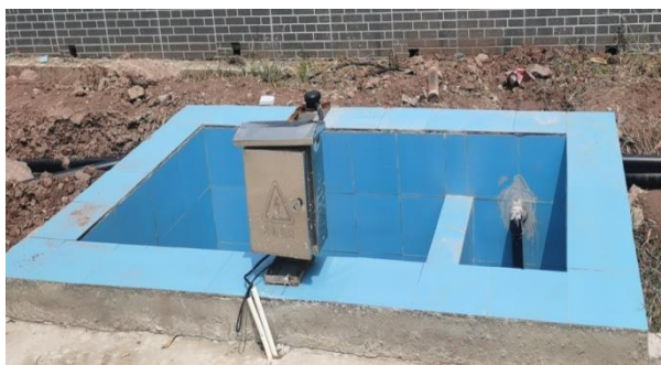
图 3-5 出水明渠

综上，验收监测期间，四川齐荣检测有限责任公司于 2023 年 5 月 10 日至 11 日对废水排放口进行了监测，监测结果表明，项目污水经处理后能够达到《城镇污水处理厂污染物排放标准》（GB18918-2002）中一级 A 标准，满足达标排放要求。