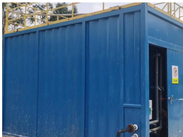
图 3-4 全封闭的一体化污水处理设备