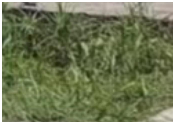
图 3-3 厂区绿化