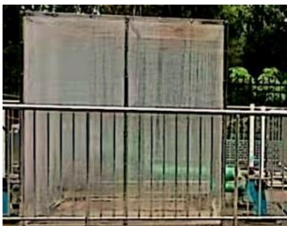
图 3-1 废气收集管道

验收监测期间，四川齐荣检测有限责任公司于 2023 年 5 月 10 日至 11 日对厂界无组织废气进行了监测，监测结果表明，本项目无组织废气（氨、硫化氢）排放浓度满足《城镇污水处理厂污染物排放标准》（GB18918-2002）表 4 中二级标准（氨 1.5\text{mg}/\text{m}^3 、硫化氢 0.06\text{mg}/\text{m}^3 ）。