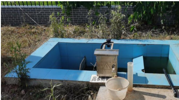
图 3-5 出水明渠

综上，验收监测期间，四川齐荣检测有限责任公司于 2023 年 3 月 1 日至 2 日对废水排放口进行了监测，监测结果表明，项目污水经处理后能够达到《城镇污水处理厂污染物排放标准》（GB18918-2002）中一级 A 标准，满足达标排放要求。