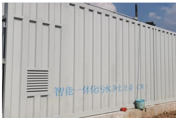
图 3-4 全封闭的一体化污水处理设备