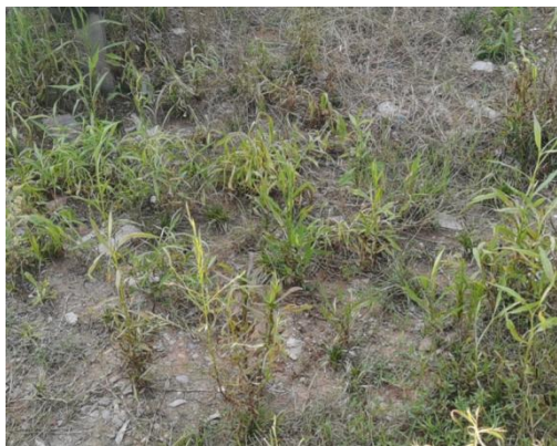
图 3-3 厂区绿化