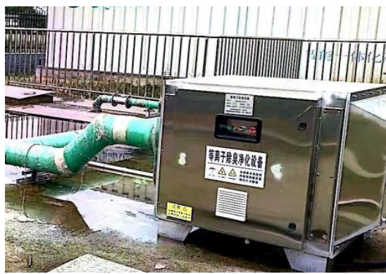
图 3-2 离子除臭装置