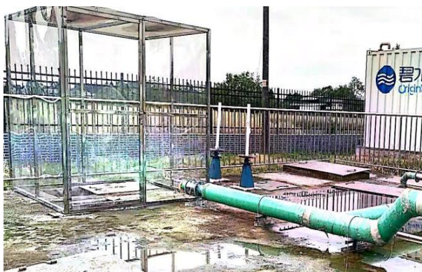
图 3-1 废气收集管道

验收监测期间，四川齐荣检测有限责任公司于 2023 年 3 月 1 日至 2 日对厂界无组织废气进行了监测，监测结果表明，本项目无组织废气（氨、硫化氢）排放浓度满足《城镇污水处理厂污染物排放标准》（GB18918-2002）表 4 中二级标准（氨 1.5\text{mg}/\text{m}^3 、硫化氢 0.06\text{mg}/\text{m}^3 ）。