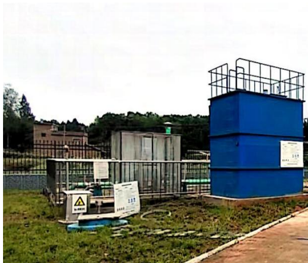
图 3-1 废气收集管道

验收监测期间，四川齐荣检测有限责任公司于 2023 年 3 月 20 日至 22 日对厂界无组织废气进行了监测，监测结果表明，本项目无组织废气（氨、硫化氢）排放浓度满足《城镇污水处理厂污染物排放标准》（GB18918-2002）表 4 中二级标准（氨 1.5mg/m 3 、硫化氢 0.06mg/m 3 ）。