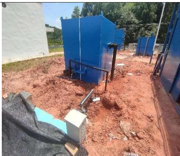
图 3-5 全封闭的一体化污水处理设备