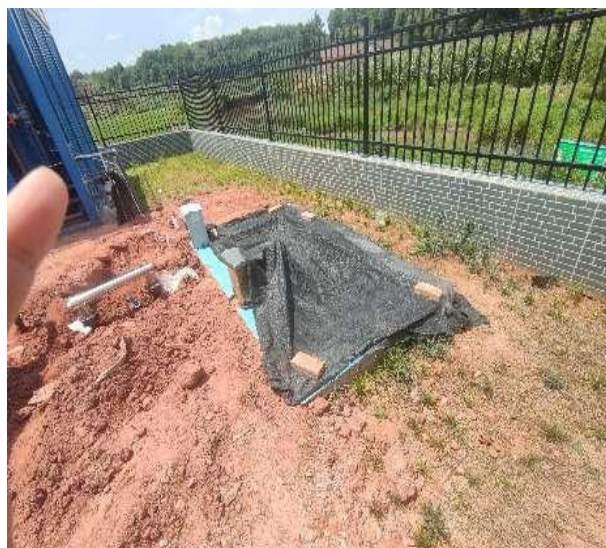
图 3-5 出水明渠

综上，验收监测期间，四川齐荣检测有限责任公司于 2023 年 3 月 20 日至 22 日对废水排放口进行了监测，监测结果表明，项目污水经处理后能够达到《城镇污水处理厂污染物排放标准》（GB18918-2002）中一级 A 标准，满足达标排放要求。