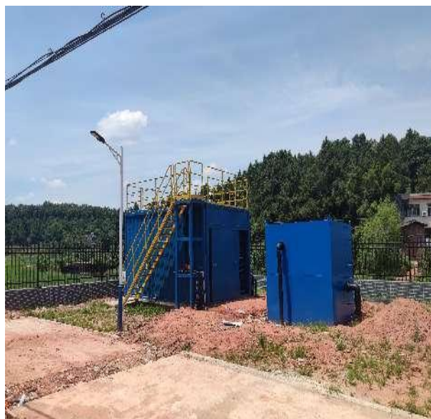
图 3-4 全封闭的一体化污水处理设备