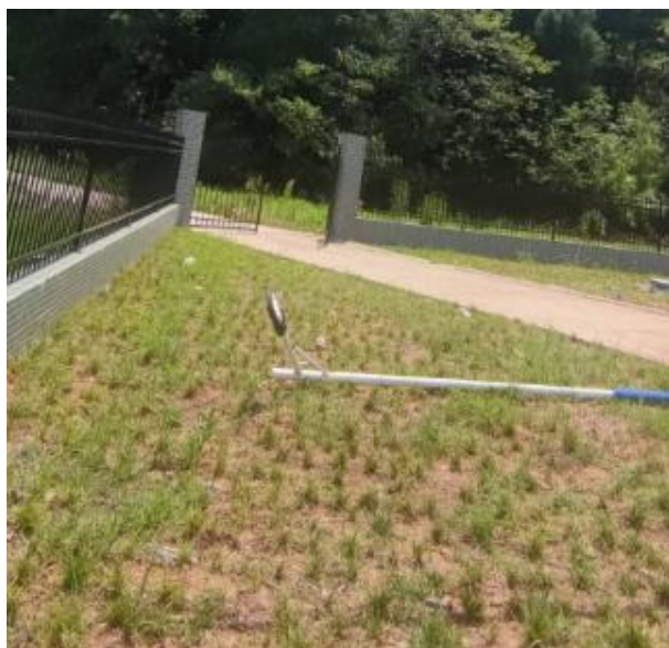
图 3-3 厂区绿化