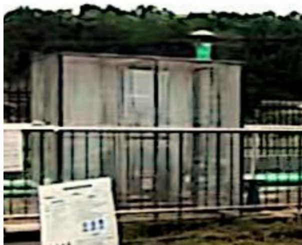
图 3-2 离子除臭装置