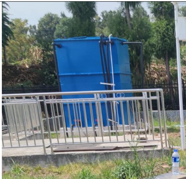
图 3-5 全封闭的一体化污水处理设备