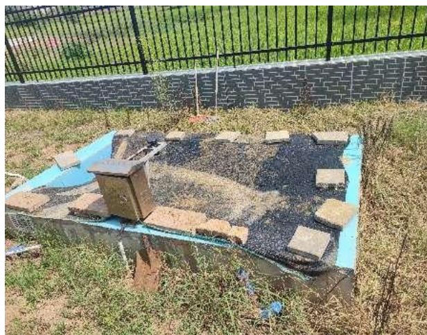
图 3-5 出水明渠

综上，验收监测期间，四川齐荣检测有限责任公司于 2023 年 3 月 6 日至 7 日对废水排放口进行了监测，监测结果表明，项目污水经处理后能够达到《城镇污水处理厂污染物排放标准》（GB18918-2002）中一级 A 标准，满足达标排放要求。