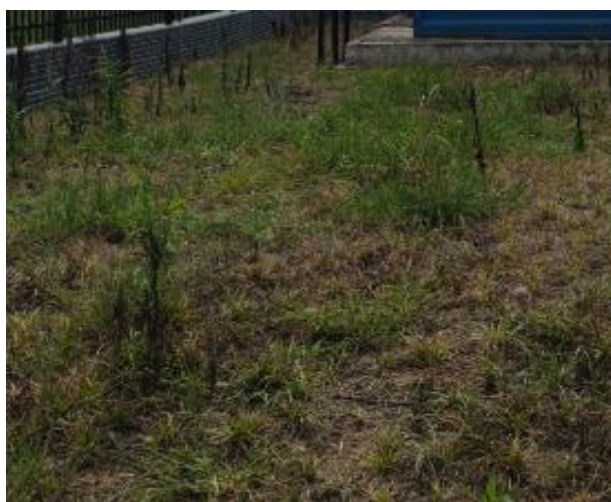
图 3-3 厂区绿化