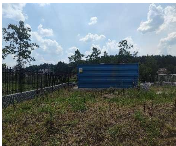
图 3-4 全封闭的一体化污水处理设备