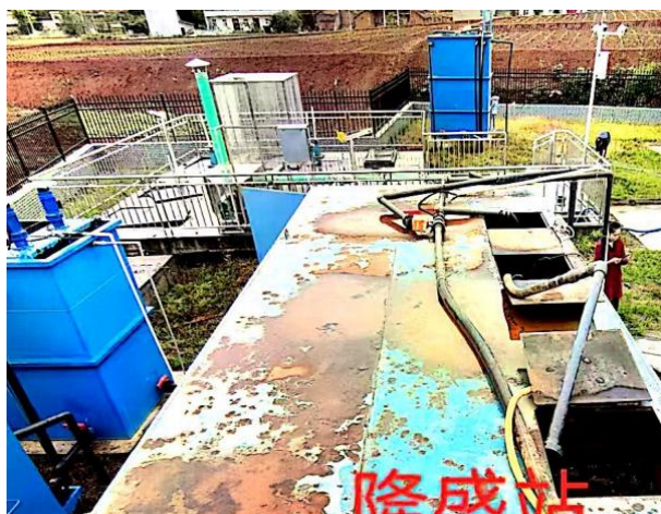
图 3-1 废气收集管道

验收监测期间，四川齐荣检测有限责任公司于 2023 年 3 月 6 日至 7 日对厂界无组织废气进行了监测，监测结果表明，本项目无组织废气（氨、硫化氢）排放浓度满足《城镇污水处理厂污染物排放标准》（GB18918-2002）表 4 中二级标准（氨 1.5\text{mg}/\text{m}^3 、硫化氢 0.06\text{mg}/\text{m}^3 ）。