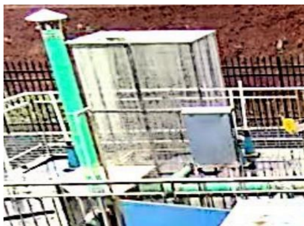
图 3-2 离子除臭装置