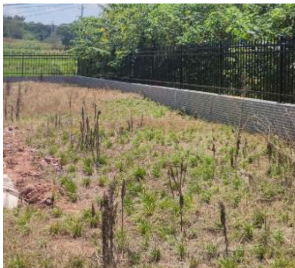
图 3-3 厂区绿化