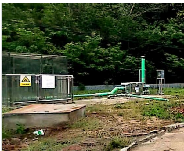
图 3-1 废气收集管道

验收监测期间，四川齐荣检测有限责任公司于 2023 年 3 月 1 日至 2 日对厂界无组织废气进行了监测，监测结果表明，本项目无组织废气（氨、硫化氢）排放浓度满足《城镇污水处理厂污染物排放标准》（GB18918-2002）表 4 中二级标准（氨 1.5\text{mg}/\text{m}^3 、硫化氢 0.06\text{mg}/\text{m}^3 ）。