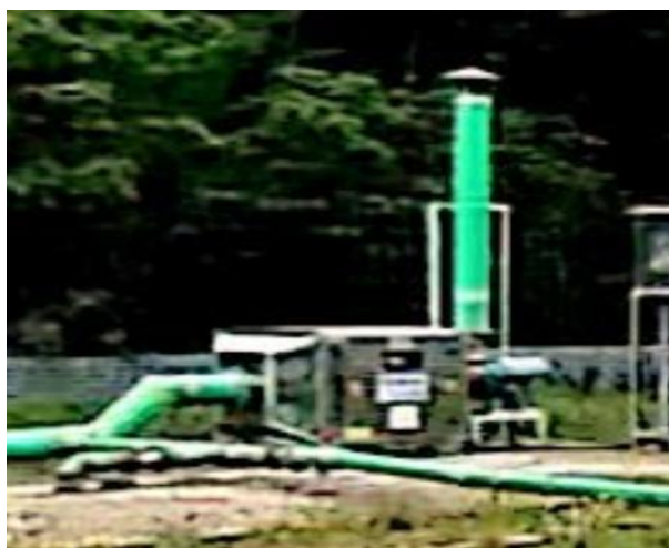
图 3-2 离子除臭装置