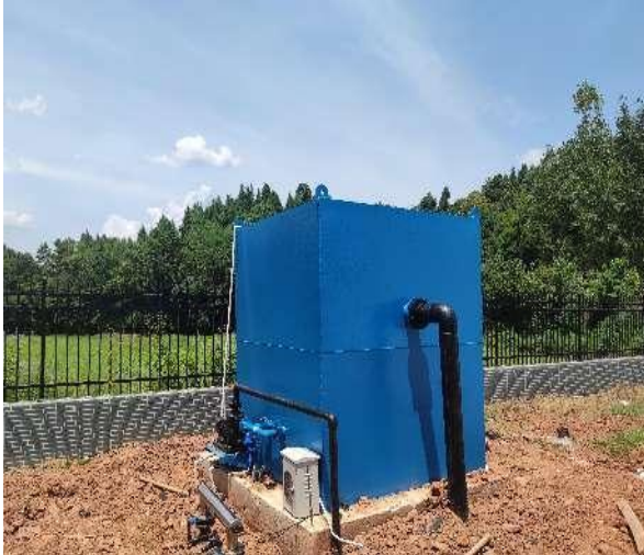
图 3-5 全封闭的一体化污水处理设备