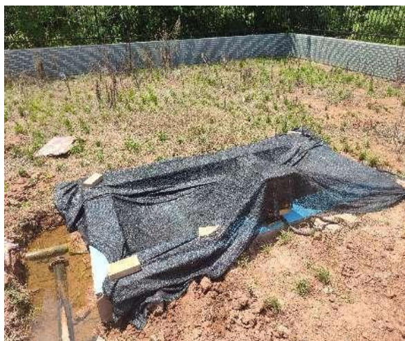
图 3-5 出水明渠

综上，验收监测期间，四川齐荣检测有限责任公司于 2023 年 3 月 1 日至 2 日对废水排放口进行了监测，监测结果表明，项目污水经处理后能够达到《城镇污水处理厂污染物排放标准》（GB18918-2002）中一级 A 标准，满足达标排放要求。