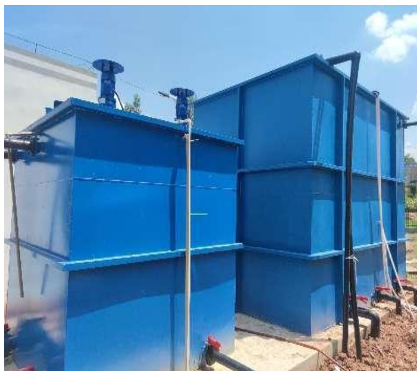
图 3-4 全封闭的一体化污水处理设备