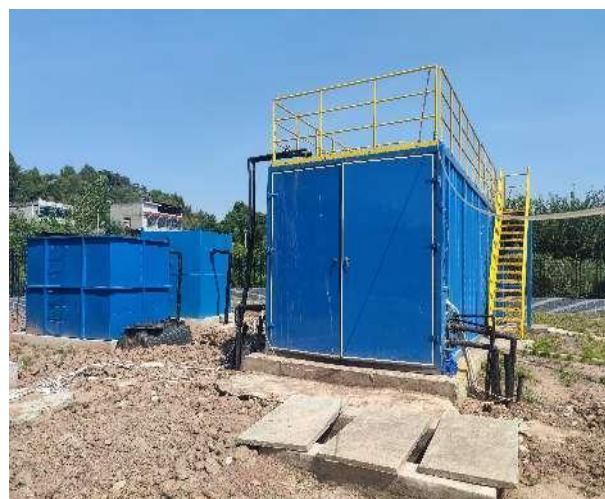
图 3-4 全封闭的一体化污水处理设备