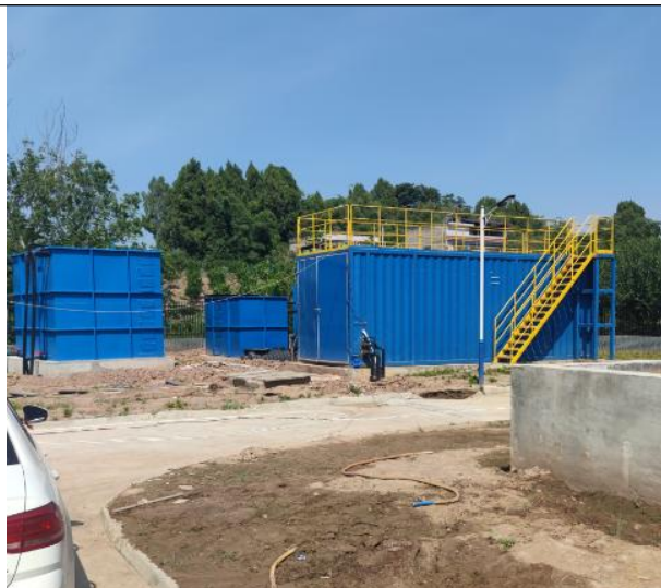
图 3-5 全封闭的一体化污水处理设备