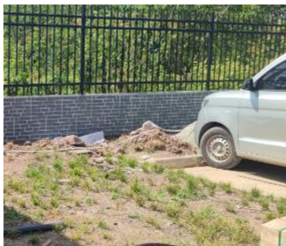
图 3-3 厂区绿化