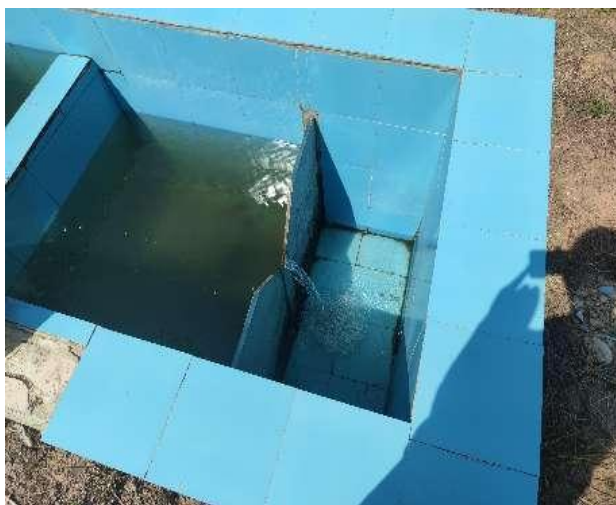
图 3-5 出水明渠

综上，验收监测期间，四川齐荣检测有限责任公司于 2023 年 3 月 8 日至 9 日对废水排放口进行了监测，监测结果表明，项目污水经处理后能够达到《城镇污水处理厂污染物排放标准》（GB18918-2002）中一级 A 标准，满足达标排放要求。