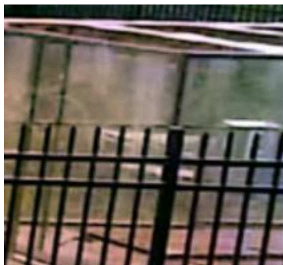
图 3-2 离子除臭装置