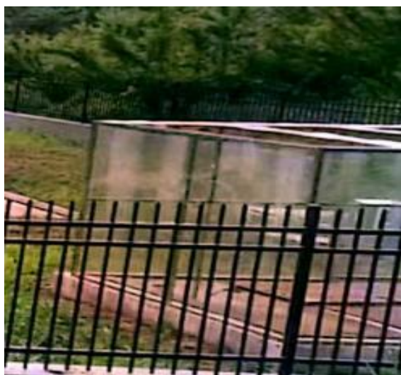
图 3-1 废气收集管道

验收监测期间，四川齐荣检测有限责任公司于 2023 年 3 月 8 日至 9 日对厂界无组织废气进行了监测，监测结果表明，本项目无组织废气（氨、硫化氢）排放浓度满足《城镇污水处理厂污染物排放标准》（GB18918-2002）表 4 中二级标准（氨 1.5\text{mg}/\text{m}^3 、硫化氢 0.06\text{mg}/\text{m}^3 ）。