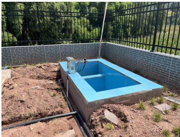
图 3-5 出水明渠

综上，验收监测期间，四川齐荣检测有限责任公司于 2023 年 3 月 13 日至 14 日对废水排放口进行了监测，监测结果表明，项目污水经处理后能够达到《城镇污水处理厂污染物排放标准》（GB18918-2002）中一级 A 标准，满足达标排放要求。