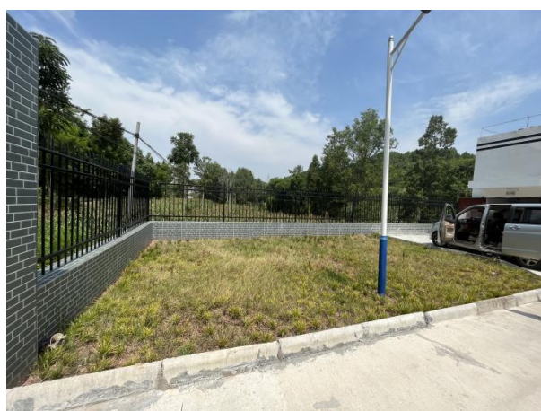
图 3-2 厂区绿化