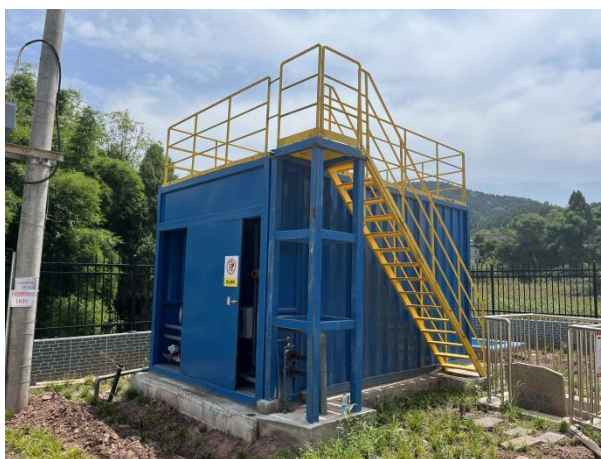
图 3-3 全封闭的一体化污水处理设备