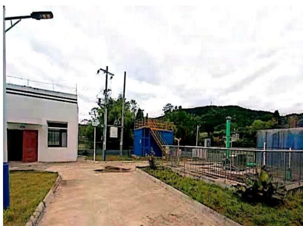
图 3-1 离子除臭装置

验收监测期间，四川齐荣检测有限责任公司于 2023 年 3 月 13 日至 14 日对厂界无组织废气进行了监测，监测结果表明，本项目无组织废气（氨、硫化氢）排放浓度满足《城镇污水处理厂污染物排放标准》（GB18918-2002）表 4 中二级标准（氨 1.5\text{mg}/\text{m}^3 、硫化氢 0.06\text{mg}/\text{m}^3 ）。