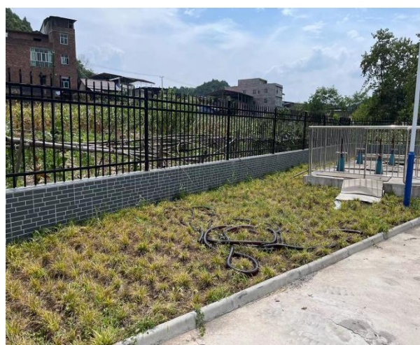
图 3-2 厂区绿化