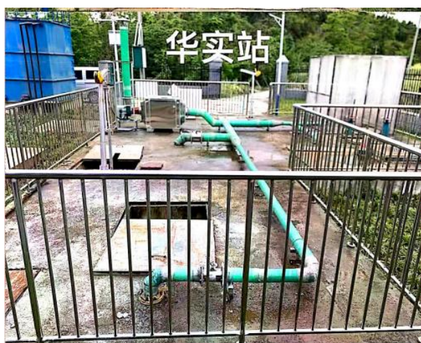
图 3-1 离子除臭装置

验收监测期间，四川齐荣检测有限责任公司于 2023 年 3 月 15 日至 16 日对厂界无组织废气进行了监测，监测结果表明，本项目无组织废气（氨、硫化氢）排放浓度满足《城镇污水处理厂污染物排放标准》（GB18918-2002）表 4 中二级标准（氨 1.5\text{mg}/\text{m}^3 、硫化氢 0.06\text{mg}/\text{m}^3 ）。