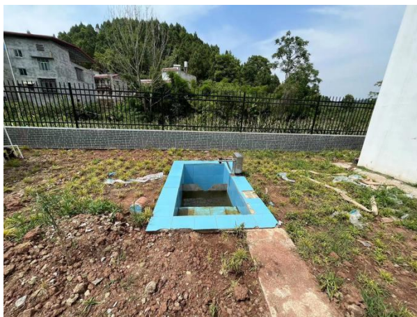
图 3-4 出水明渠

综上，验收监测期间，四川齐荣检测有限责任公司于 2023 年 3 月 15 日至 16 日对废水排放口进行了监测，监测结果表明，项目污水经处理后能够达到《城镇污水处理厂污染物排放标准》（GB18918-2002）中一级 A 标准，满足达标排放要求。