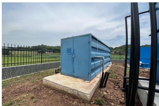
图 3-2 全封闭的一体化污水处理设备