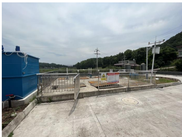
图 3-3 预处理池