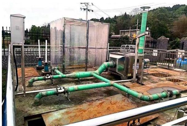
图 3-1 废气收集管道、离子除臭装置

验收监测期间，四川齐荣检测有限责任公司于 2023 年 5 月 23 日至 24 日对厂界无组织废气进行了监测，监测结果表明，本项目无组织废气（氨、硫化氢）排放浓度满足《城镇污水处理厂污染物排放标准》（GB18918-2002）表 4 中二级标准（氨 1.5\text{mg}/\text{m}^3 、硫化氢 0.06\text{mg}/\text{m}^3 ）。