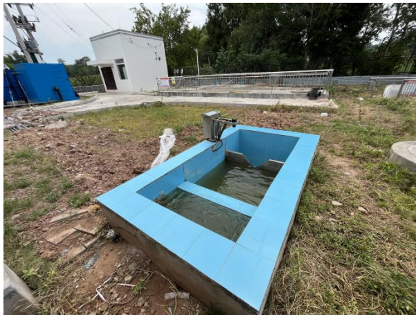
图 3-5 出水明渠

综上，验收监测期间，四川齐荣检测有限责任公司于 2023 年 5 月 23 日至 24 日对废水排放口进行了监测，监测结果表明，项目污水经处理后能够达到《城镇污水处理厂污染物排放标准》（GB18918-2002）中一级 A 标准，满足达标排放要求。