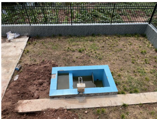
图 3-4 出水明渠

综上，验收监测期间，四川齐荣检测有限责任公司于 2023 年 3 月 20 日至 21 日对废水排放口进行了监测，监测结果表明，项目污水经处理后能够达到《城镇污水处理厂污染物排放标准》（GB18918-2002）中一级 A 标准，满足达标排放要求。