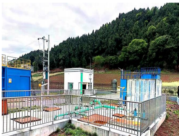
图 3-1 废气收集管道及离子除臭装置

验收监测期间，四川齐荣检测有限责任公司于 2023 年 3 月 20 日至 21 日对厂界无组织废气进行了监测，监测结果表明，本项目无组织废气（氨、硫化氢）排放浓度满足《城镇污水处理厂污染物排放标准》（GB18918-2002）表 4 中二级标准（氨 1.5\text{mg}/\text{m}^3 、硫化氢 0.06\text{mg}/\text{m}^3 ）。