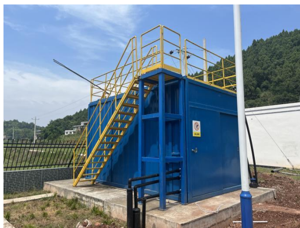
图 3-2 全封闭的一体化污水处理设备