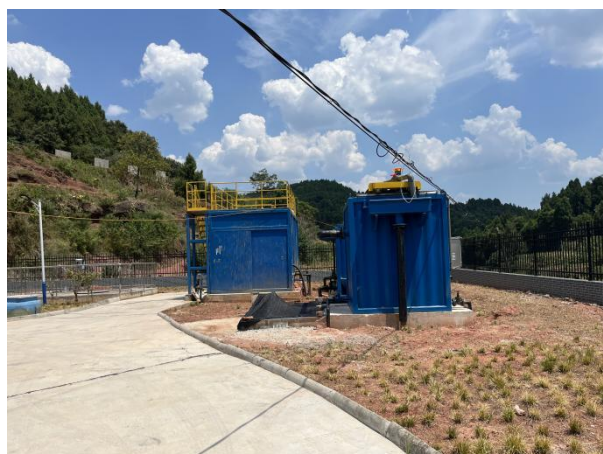
图 3-2 全封闭的一体化污水处理设备