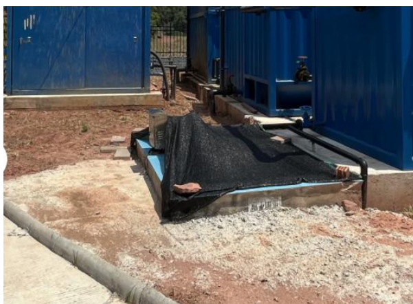
图 3-5 出水明渠

综上，验收监测期间，四川齐荣检测有限责任公司于 2023 年 3 月 8 日至 9 日对废水排放口进行了监测，监测结果表明，项目产生的生活污水经处理后能够达到《城镇污水处理厂污染物排放标准》（GB18918-2002）中一级 A 标准，满足达标排放要求。