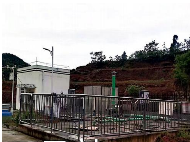
图 3-1 废气收集管道及离子除臭装置

验收监测期间，四川齐荣检测有限责任公司于 2023 年 3 月 8 日至 9 日对厂界无组织废气进行了监测，监测结果表明，本项目无组织废气（氨、硫化氢）排放浓度满足《城镇污水处理厂污染物排放标准》（GB18918-2002）表 4 中二级标准（氨 1.5\text{mg}/\text{m}^3 、硫化氢 0.06\text{mg}/\text{m}^3 ）。