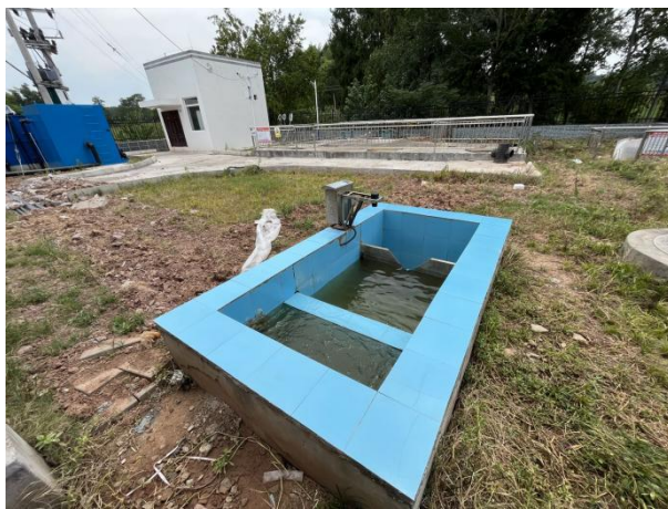
图 3-5 出水明渠

综上，验收监测期间，四川齐荣检测有限责任公司于 2023 年 5 月 8 日至 9 日对废水排放口进行了监测，监测结果表明，项目产生的生活污水经处理后能够达到《城镇污水处理厂污染物排放标准》（GB18918-2002）中一级 A 标准，满足达标排放要求。