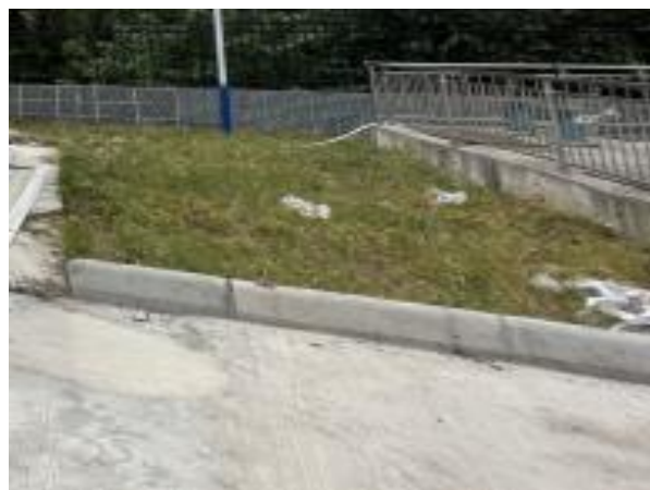
图 3-3 厂区绿化