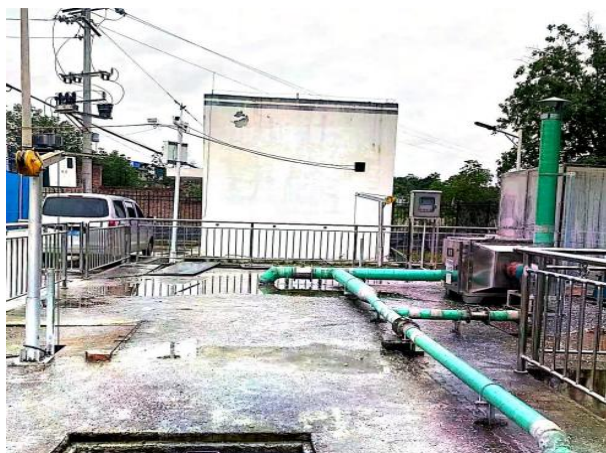
图 3-1 格栅单独隔间、废气收集管道、离子除臭装置

验收监测期间，四川齐荣检测有限责任公司于 2023 年 5 月 8 日至 9 日对无组织废气进行了监测，监测结果表明，本项目无组织废气（氨、硫化氢）排放浓度满足《城镇污水处理厂污染物排放标准》（GB18918-2002）表 4 中二级标准（氨 1.5\text{mg}/\text{m}^3 、硫化氢 0.06\text{mg}/\text{m}^3 ）。