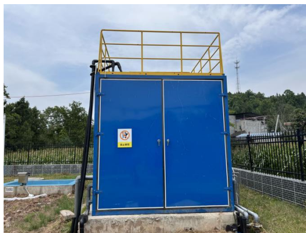
图 3-2 全封闭的一体化污水处理设备